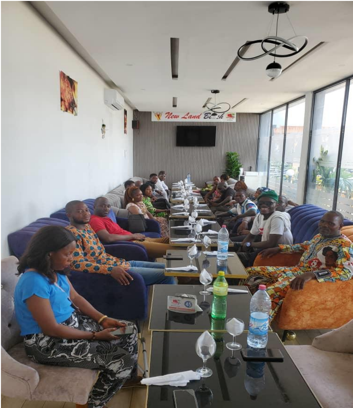
b- Un grupo del personal del hospital de Tanguiéta tratando el tema de la "misión compartida".