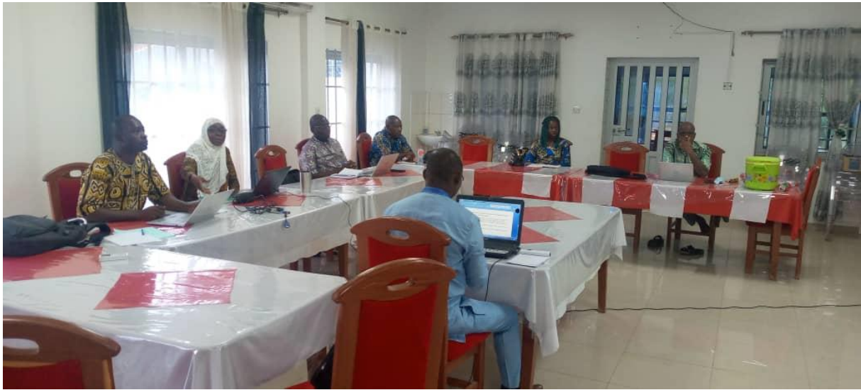
c -Riunione dei coordinatori dei gruppi di sensing della Provincia di San Riccardo Pampuri.